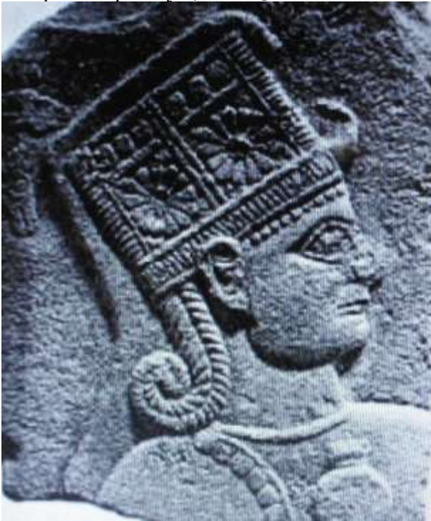
Рис 2. Голова хеттської богині в головному уборі з орнаментами. 1050-850 роки до н.е.

Такий глибокий висновок можна зробити порівнявши хеттсько-гетський пісенний фольклор, топоніміку, етнімію і особливо хеттське письмо та мову, які по основних компонентах ідентичні по мовних компонентах та письму з мовою та письмом Велесової Книги. Таким чином культура письмо стародавніх хеттів та гетів мають в своїй основі споріднені еволюційні похідні, що дає право наголошувати, що ці народи, якщо не майже тотожні, то десь близько знаходилися в етногенезі історичного розвитку[9,с.12-20; с.8-9]. Поширення хеттів з сучасної території Туреччини та їх розселення в басейні Дністра зумовлене натиском кочових народів на нижнє Подунав'я. Власна така ситуація в якій гети вступали у військові конфлікти з вищеназваними народами дала їм можливість попасти на шпальти давньогрецьких, римських та готського історика Йордана[11,с.56-67].