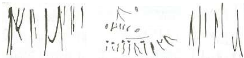
Рис.1. Стародавнє письмо з Кам'яної Могили, що на території України (VII-VI тис. до н.е.)

Сьогодні вже за сукупністю проаналізованих джерел гіпотетично можемо зробити реконструкцію, яку подаємо нище, як розвиток української мови: