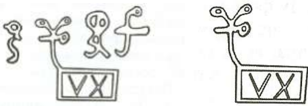
Рис.2. Стародавня писемність з якої еволюціонувала Індосвропейська писемність.