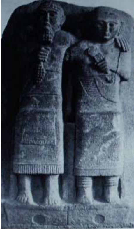
Рис.1.Хеттський надгробок на могилі подружньої пари. Кінець VIII - поч. VII ст. до н.е.

Згідно свідчень античних і римських джерел, великий народ гетів своїми поселеннями та містами, з глибоко стародавньою, праслов'яно-українською культурою, мовою, пісенно-белінним фольклором та самотньою язичницькою релігією, поширювався по нижньому Подунав'ю та нижньому та середньому Подністров'ю[10, с.5-42; с.12-20; с.5-14; с.107-126; с.80-84; с.15-28; с. 16-71].