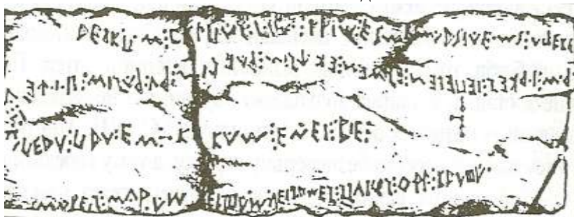
Рис.3. Слов'янська писемність регіонів Дунаю I тис. до н.е - I тис. н.е.