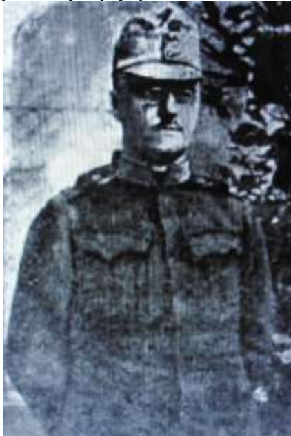
Рис.8.Археолог та мовознавець Бедржих Грозний у 1915 році.

Б.Грозний відкивав їх мову та історію. Йому стало відомо, що хетти, як індоєвропейці, задовго прийшли у Європу і мали своє письмо задовго до епохи Гомера. Вивчивши хеттську мову він прийшов до висновку, що хеттська мова споріднена з італо-кельтськими, латинськими та слов'янськими мовами, а ті племена, які входили в Хеттську державу очевидно були : кельти, латини, слов'яни, українці, а це ховорить, що в українців, які були споріднені і найбільш близькі етно-територіально до політичних стародавніх центрів Хеттської цивілізації, появились стародавні історичні коріння, де пра-українську мову можна виводити із хеттської, по крайній мірі так засвідчив нам своїми дослідження чеський мовознавець та хеттолог у 1910 році Бедржих Грозний, який наголосив: «що хеттська мова є родинно споріднена з пра-українською мовою, яка розвинулася в Карпасько-Дністровському. Побужському та Дніпровському регіонах сучасної України і про функціонувала скрізь віки, модернізуючись до сучасного часу». Таким чином, мова Хеттського царства в період його розквіту заклала початки розвитку праукраїнської мови».