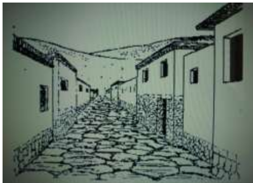
Рис.1,2.Реконструкція царських воріт та міської вулиці столиці хеттів міста Хаттуса.