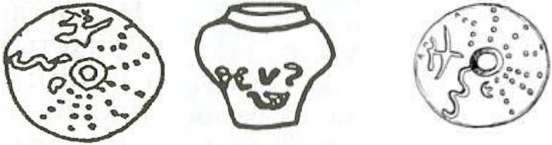
Рис.2.Стародавня Трипільська писемність на території України (V-II тис. до н.е.)