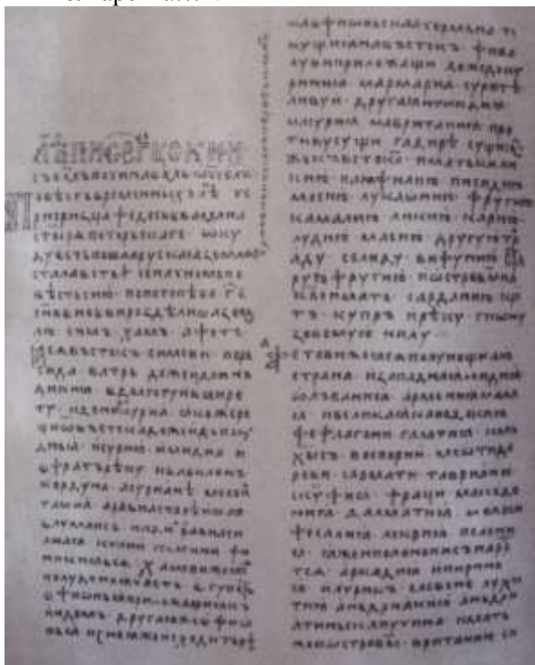
Рис.7. Титульна сторінка літопису Нестора літописця.

Від цих ото сімдесяти і двох народів, од племені таки Яфетового, постав народ слов'янський, так звані норики, які є слов'янами. По довгих же часах сіли слов'яни по Дунаєві, де є нині Угорська земля і Болгарська...».