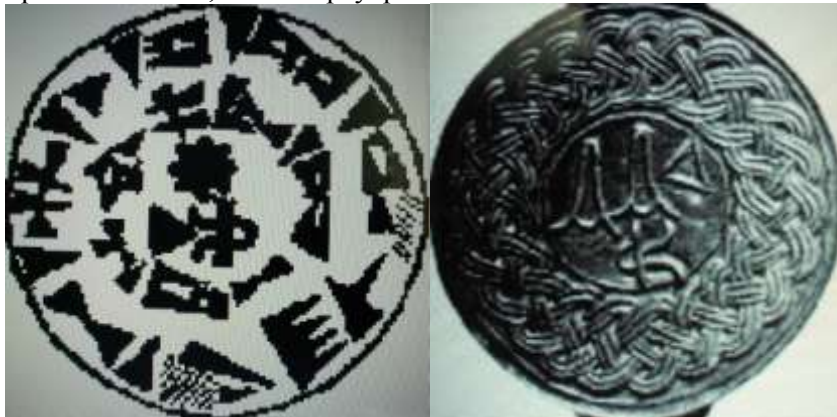
Рис 5. Написи з клинописами хеттської мови з печатки хеттського царя Табарна. Рис 6. Золота печатка з клинописами хеттської мови хеттського царя Супілуіума I (близько 1400/1200 роки до н.е.).

письмо, яке на їх думку могло слугувати виникненню праслов'янської, а отже праукраїнської письменності.