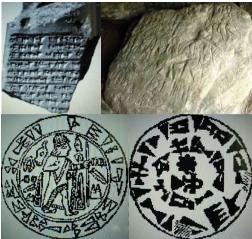
Рис.2. Хеттська писемність з якої еволюціонувала – слов'янська II-I тис. до н.е.