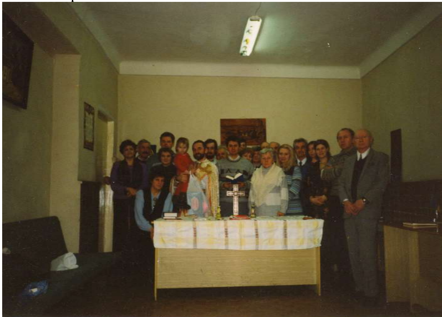
Українська греко-католицька громада м. Москви - шанувальник журналу «Українознавець»!