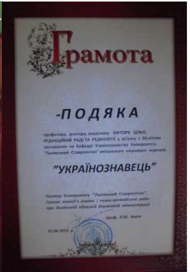
Академік Віктор Ідзьо - засновник та головний редактор наукового журналу Українознавець. Грамота - Подяка "Українознавцю" з нагоди 10-тиліття.

Таким чином, глибоке осмислення культурно-освітнього життя українців на сторінках наукового часопису "Українознавець" за десятиліття (2005-2015рр.) актуальне не тільки з наукової, але й суспільно-політичної точки зору. Проблема привертає увагу науковців та широкого загалу. Критичне використання джерельного комплексу дозволяє з'ясувати сучасний стан, повноту і достовірність вивчення проблеми, виявити недостатньо досліджені питання та виробити рекомендації для подальших наукових пошуків.