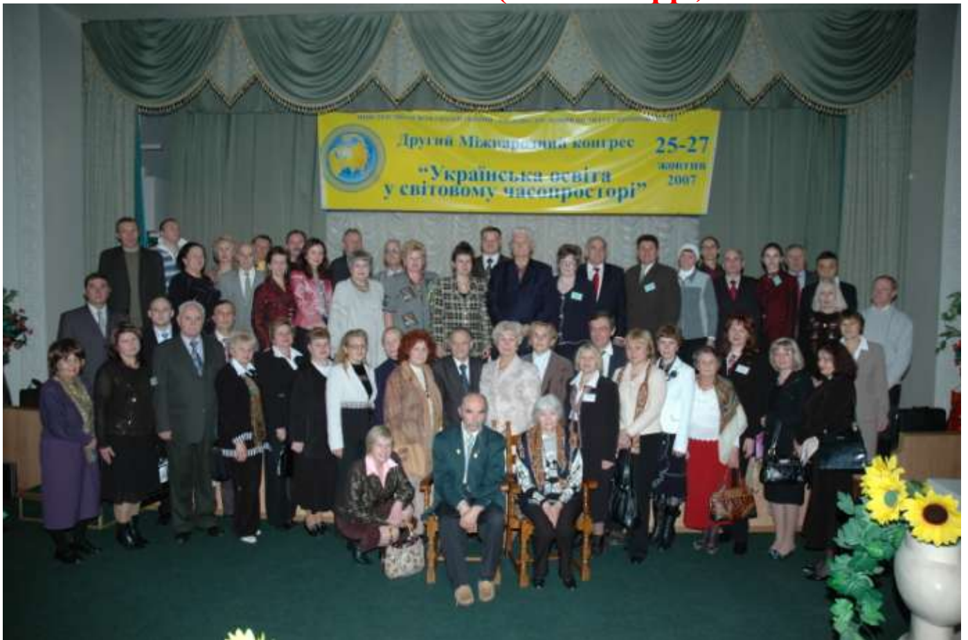
Переднє слово головного редактора The first word of the editor-in-chief