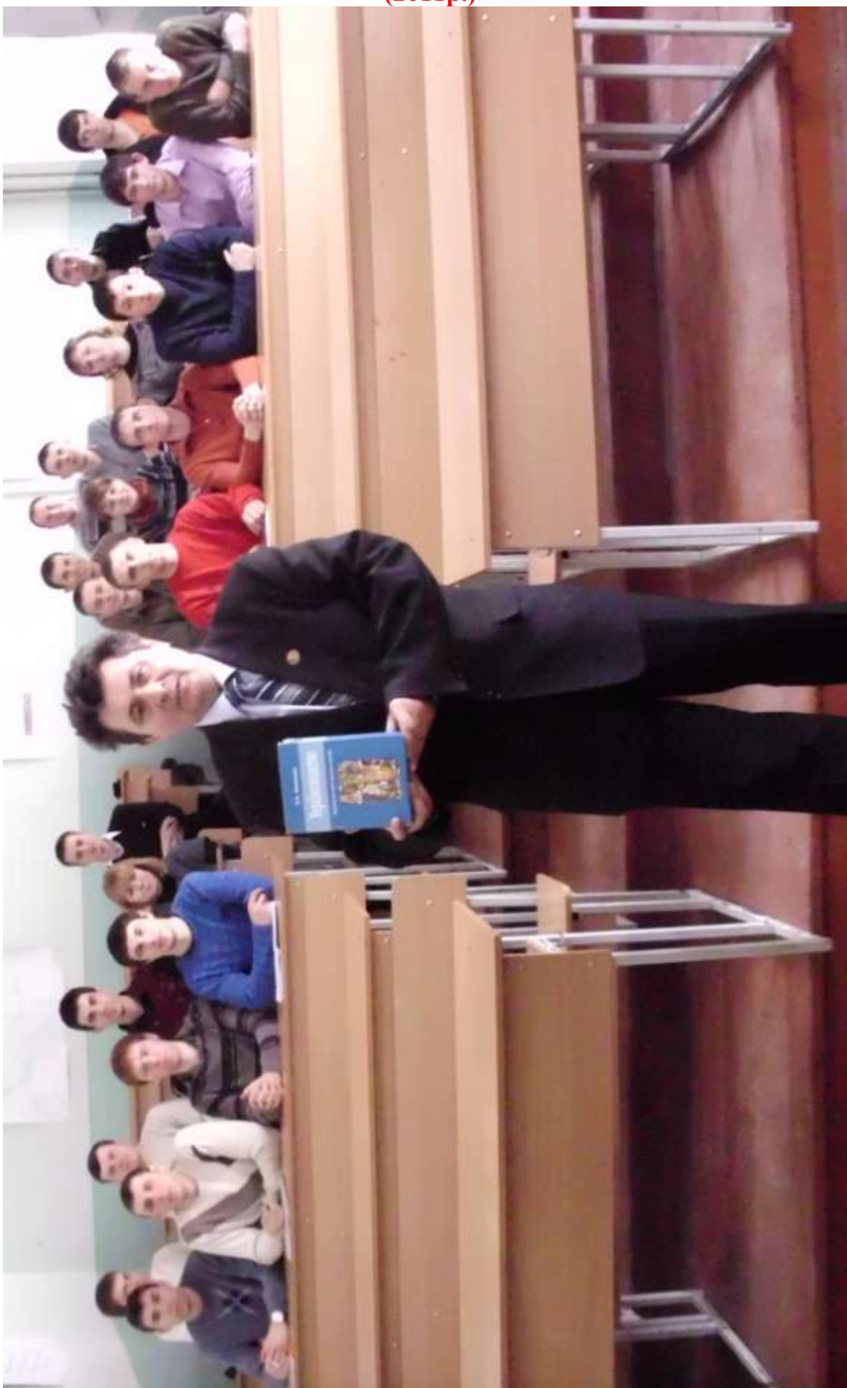
Академік Віктор Ідзьо серед студентів освітньо кваліфікаційного рівня “магістр”, авторів наукових праць з лекційного курсу «Українознавство». (2011р.)