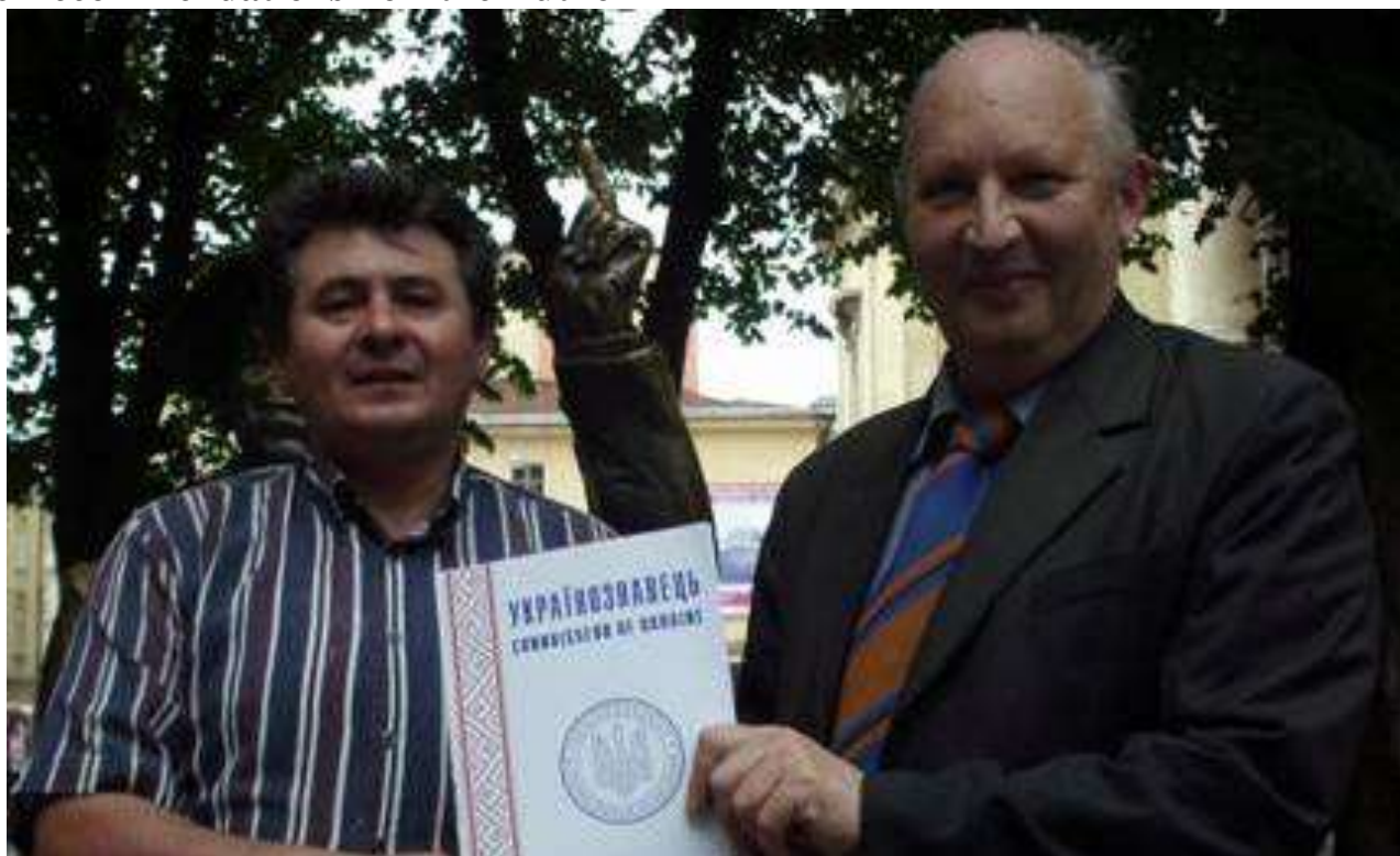
Головний редактор В.Ідзьо, І.Огірко - технічний редактор наукового журналу «Українознавець»