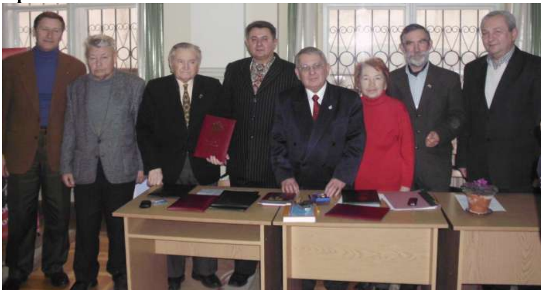
Українознавець – наш журнал!