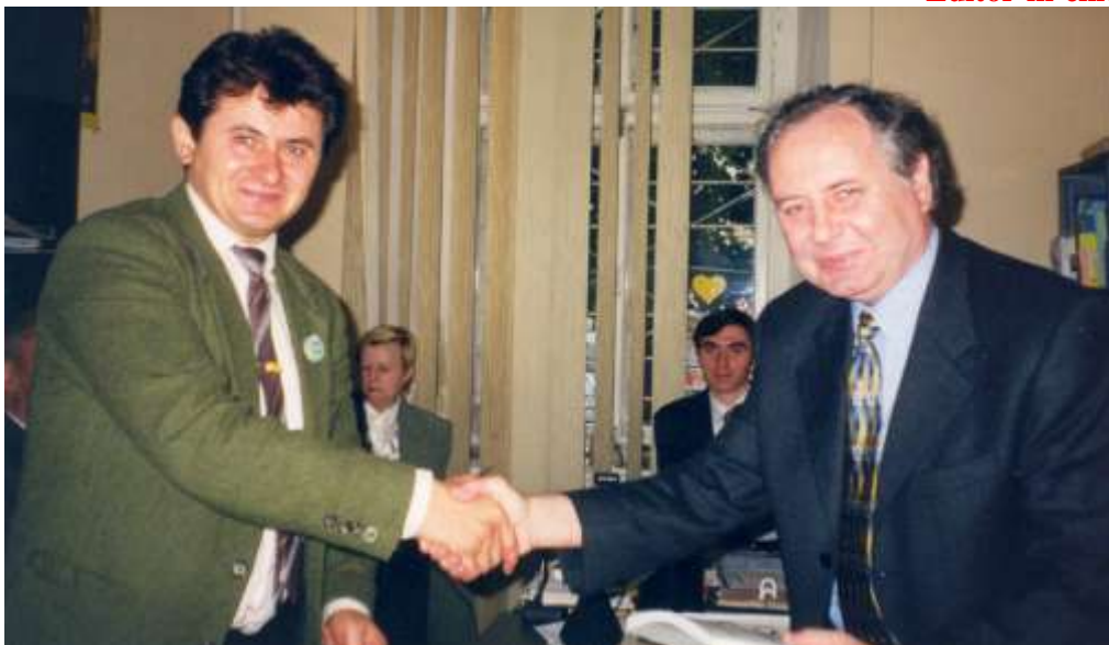
Ректор Українського Університету м.Москви, професор Університету «Львівський Ставропігон». Ректор Університету «Львівський Ставропігон» професор Українського Університету м.Москви.