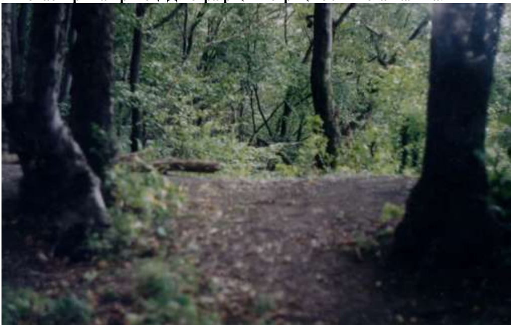
Мал. 6. Вхід на верхню культову площадку печерного язичницького та християнського комплексу “Монастир” на притоці Дністра ріці Бистриця біля міста Галича.