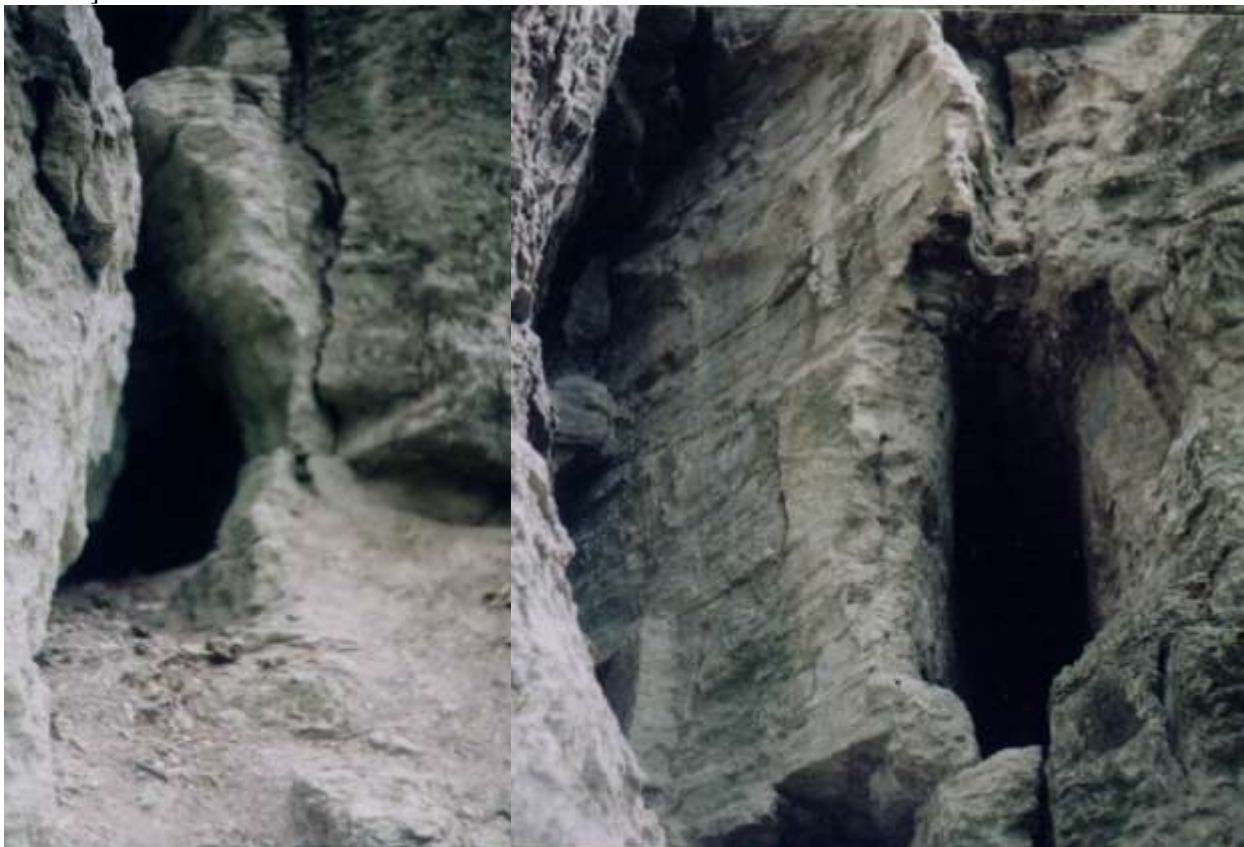
Мал. 3. Печерний язичницький та християнський комплекс “Монастир” на притоці Дністра ріці Бистриця біля міста Галича.1.Нижня печера. 2.Верхня печера. Основного входу.

В 70 поч. - 80 років XX століття, автор даного дослідження, юнаком, а опісля студентом історичного факультету Прикарпатського державного університету, вперше декілька разів відвідав з археологічно-пошуковою метою цю пам'ятку. Вона надовго залишилася своєю величчю і загадковістю в пам'яті без пояснення, хоча уже тоді широко була відома під назвою “Монастир”, яку автор в той час зафіксував на фото(Мал.1) [9, с.225-275; с.176-179; с.18-22; с.383-385; с.280-289; с. 5; с.6; с.99-103; с.729-731].