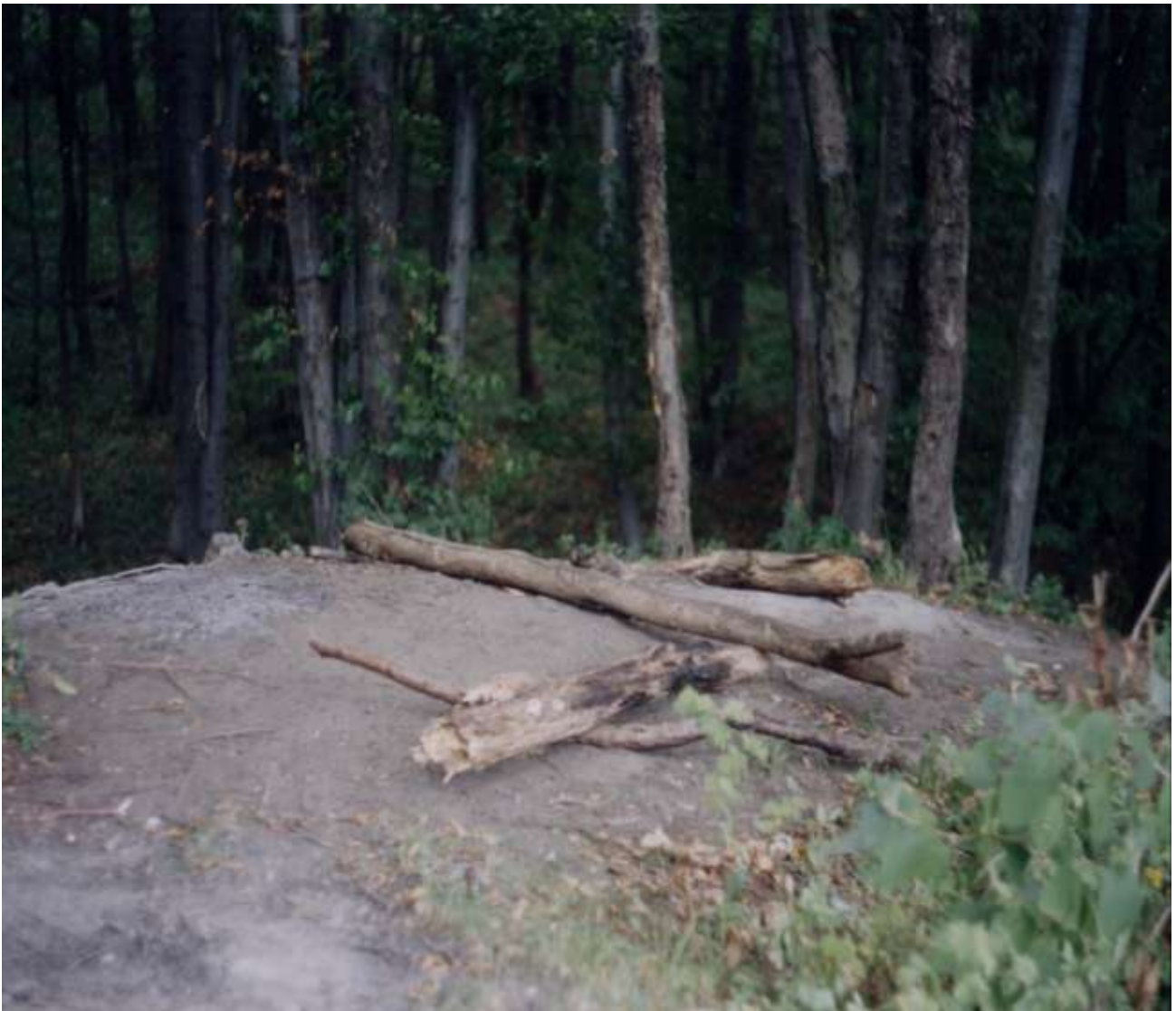
Мал. 7. Верхня культова площадка печерного язичницького та християнського комплексу “Монастир” на притоці Дністра ріці Бистриця біля міста Галича.