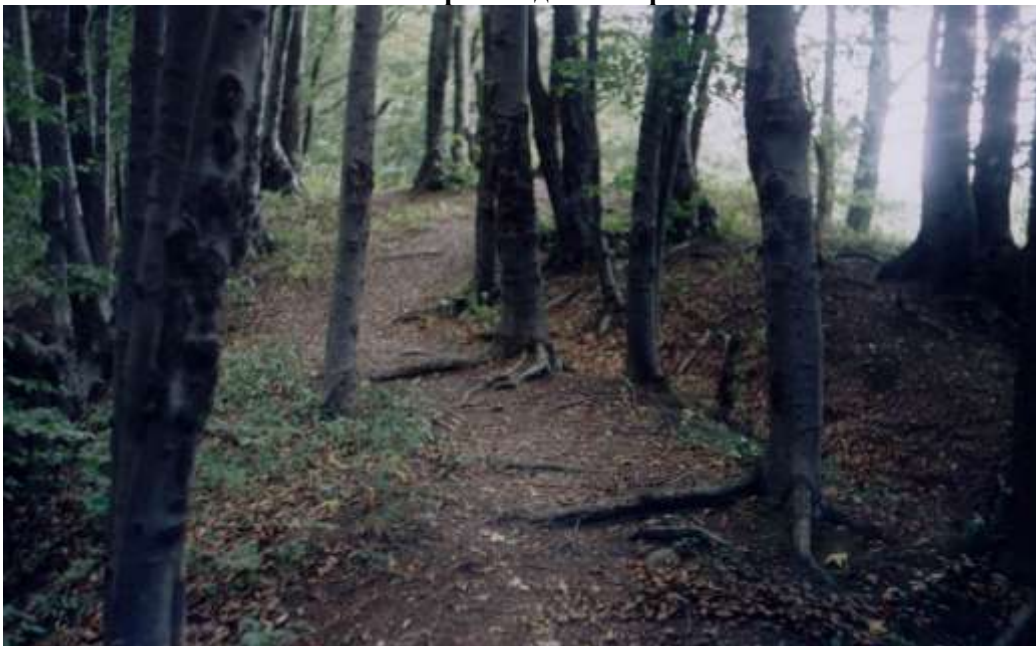
Мал. 5. Дорога на верхню культову площадку печерного язичницького та християнського комплексу “Монастир” на притоці Дністра ріці Бистриця біля міста Галича.