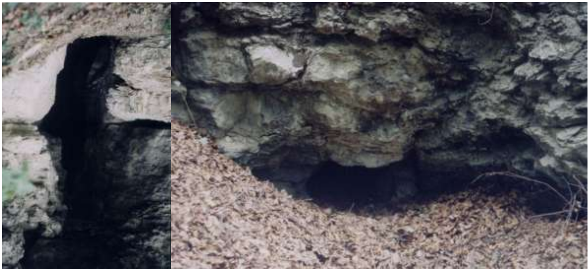
Мал. 4. Печерний язичницький та християнський комплекс “Монастир” на притоці Дністра ріці Бистриця біля міста Галича.3.Бокова печера.2.Задня печера.