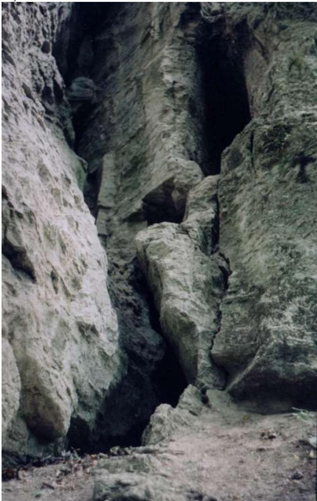
Мал. 1. Печерний язичницький та християнський комплекс “Монастир” на притоці Дністра ріці Бистриця біля міста Галича.

Пам'ятка “Монастир” розташована територіально на землях села Сілець Тисменицького району Івано-Франківської області, біля села Ізуполя в лісі “Бійне” навпроти сіл: Угринів, Клузів, Ямниця, Тянів, з правого боку ріки Бистриці [9, с.225-275; с.176-179; с.18-22; с.383-385; с.280-289; с. 5; с.6; с.99-103; с.729-731].