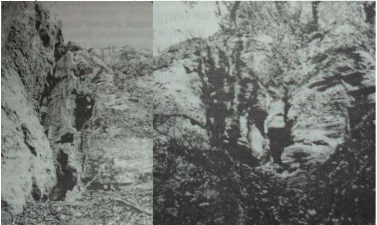
Мал. 2. Печерний язичницький та християнський комплекс “Монастир” на притоці Дністра ріці Бистриця біля міста Галича зв фото-матеріалами кінця XIX - початку XX століття.

Ця пам'ятка привернула увагу дослідників стародавньої історії уже в XIX столітті. Власне з цього часу вона розпочинає відлік свого наукового вивчення[6, с.15-37; с.63-69].