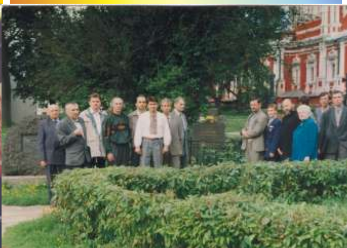
Фото 15. Міжнародні наукові конференції Українського державного університету міста Москви. Фото 16. Колектив УУМ, гості ОУР на могилі українського історика О.Борянського в Москві.