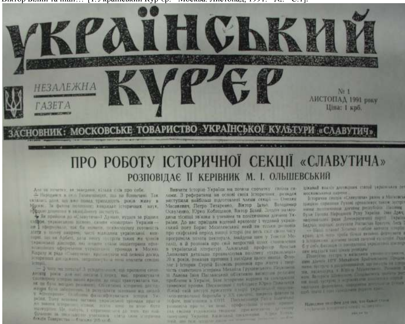
Фото 1. Перше число газети Український Кур'єр. - Москва. Листопад, 1991. - №1.