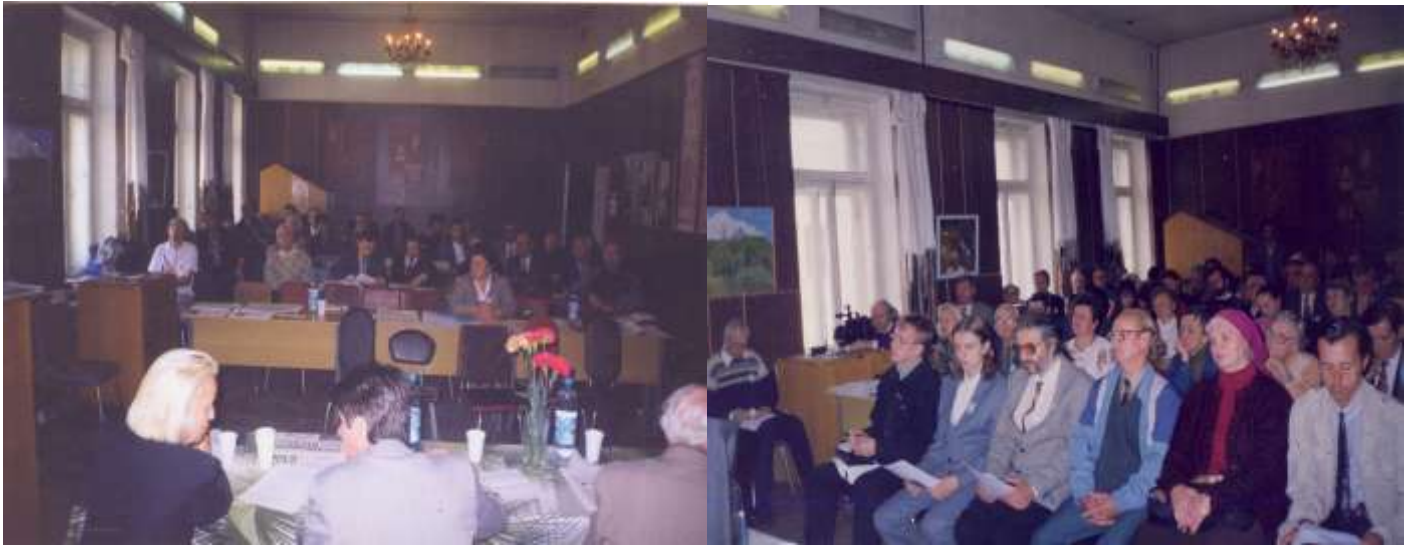
Фото 12. Робота колективу Українського університету міста Москви під керівництвом ректора доктора історичних наук, професора, академіка Міжнародної Академії Наук Євразії В.С. Ідзьо