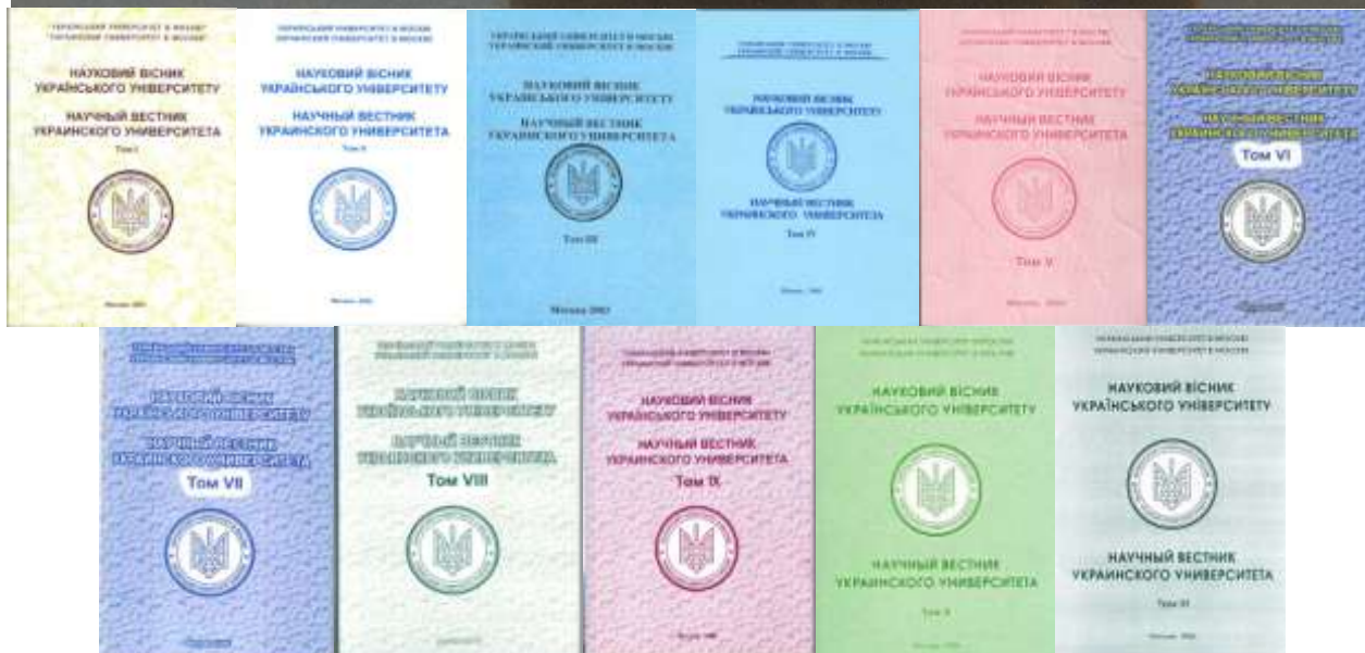
Науковий Вісник Українського державного університету у 2001-2006 роках.