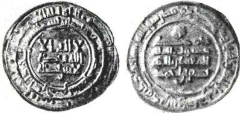
Рис. 14 Арабський дірхем епохи грошової системи України-Русі X-XI століть.

Під таким кутом зору, дана проблема потребує подальшого дослідження.