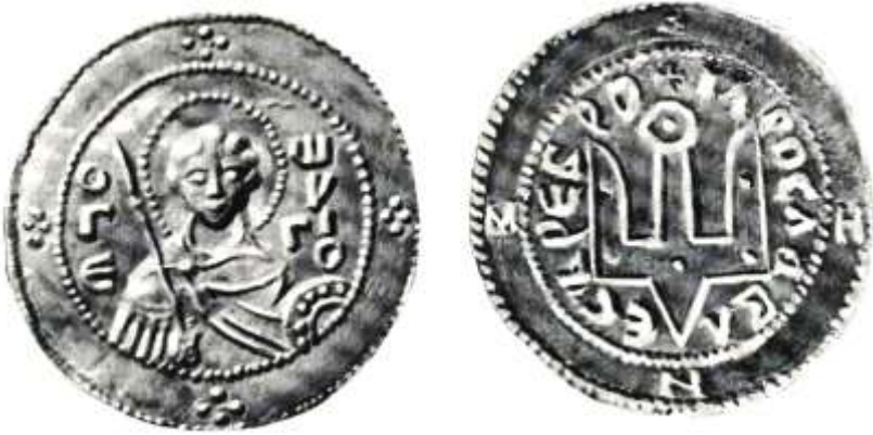
Рис. 13 Срібна гривня Ярослава Володимировича (Мудрого) (тип I)

Особливої уваги заслуговують срібні монети Ярослава Володимировича з зображеннями на лицевій стороні святого Георгія, під яким можна уловити лице самого Ярослава Мудрого і з другої сторони монети державного гербу України-Русі Тризуба з написом навколо “Ярославове срібло”/12.