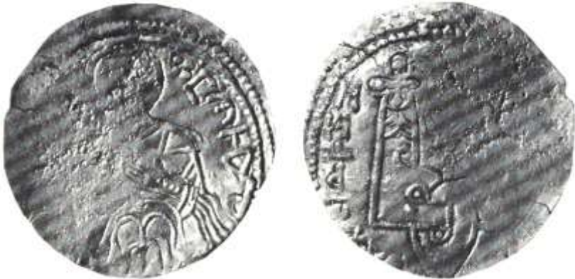
Рис. 12 Срібна гривня Святополка Володимировича з іменем “Петрос” (тип III)

Останній же тип монет з іменем „Петрос” очевидно слід віднести до 1017-1018 років, коли Святополк Володимирович відновив своє володарювання в Києві за допомогою свого тестя польського короля Болеслава Хороброго. Як вважають вчені випуск своїх срібних монет з іменем Петра Святополк міг відновити по другому вокняженні в Києві. Вчені наголошують, що цілком можливо, що християнське ім'я Святополка було Петро, що відмічено на монетах/11.