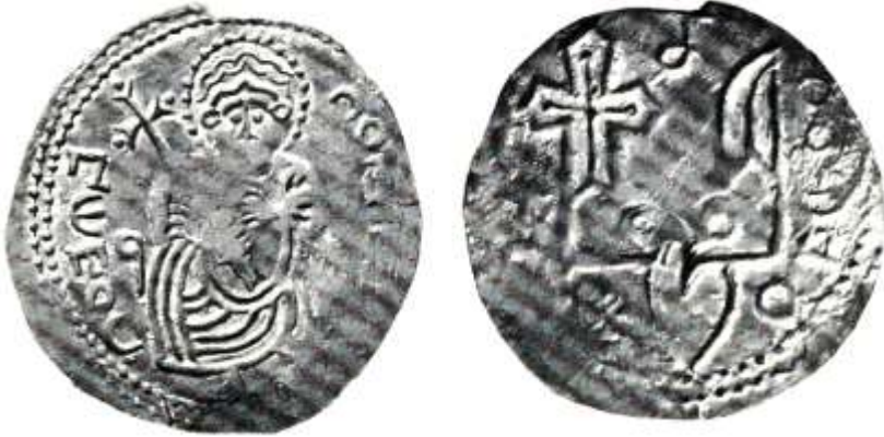
Рис. 11 Срібна гривня Святополка Володимировича з іменем “Петрос” (тип II)

Останній же тип монет з іменем „Петрос” очевидно слід віднести до 1017-1018 років, коли Святополк Володимирович відновив своє володарювання в Києві за допомогою свого тестя польського короля Болеслава Хороброго. Як вважають вчені випуск своїх срібних монет з іменем Петра Святополк міг відновити по другому вокняженні в Києві. Вчені наголошують, що цілком можливо, що християнське ім'я Святополка було Петро, що відмічено на монетах/11.