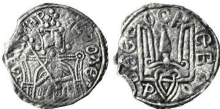
Рис.7 Срібна гривня Володимира Святославовича (тип III)