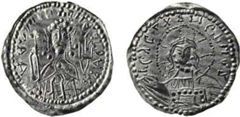
Рис. 3 Золота гривня Володимира Святославовича

Подаємо срібну гривню Володимира Святославовича, яка класифікується вченими як монета першого типу.