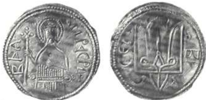
Рис.6 Срібна гривня Володимира Святославовича (тип II)