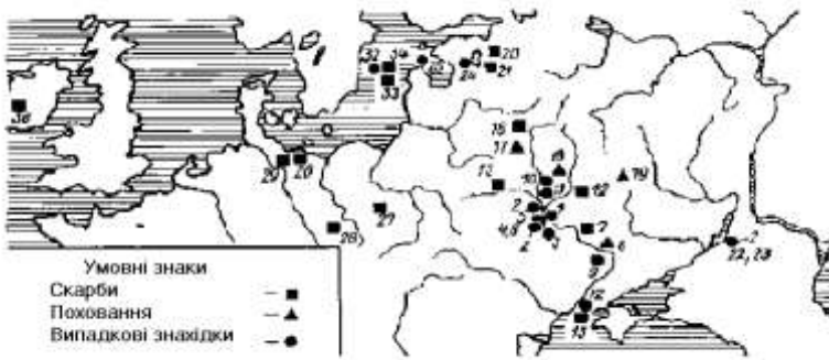
Рис.1 Поширення монет Української держави в Європі в X-XI столітті

Самі обставини введення золотих та срібних монет – гривень були зумовлені перейняттям Україною-Руссю фінансової системи Візантійської імперії, яка внаслідок хрещення України-Русі та включення останньої в культурну та торгову систему імперії, запозичила в останньої і фінансово-грошову систему. Результатом запозичення стали різної вартості староукраїнські монети, які зафіксували для наступних українських поколінь факт староукраїнської державності та її грошово-фінансової системи водночас засвідчують факт високого ремесла та мистецтва, писемності як і культури взагалі в українській державі в X-XI століттях/2.