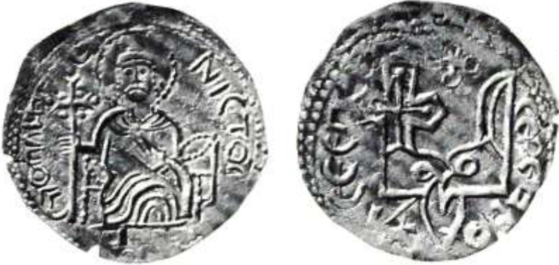
Рис. 10 Срібна гривня Святополка Володимировича тип (I)

Особливою за чеканкою є один тип срібної монети великого київського князя Ярослава Володимировича/7.