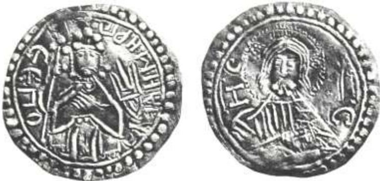
Рис. 4 Срібна гривня Володимира Святославовича (тип I)

Як бачимо із всіх перших монет Володимира Святославовича, вони виготовлені при певній професійній підготовці штемплів для їх чеканки, що може говорити, що уже при Володимирі Святославовичу в Києві, була спроба налагодження першого українського монетного двору, який міг функціонувати на зразок візантійського, звичайно в значно скромнішому вигляді. Дослідники вважають, що монети виготовлялись, як золоті та і срібні з литих заготовок/5.