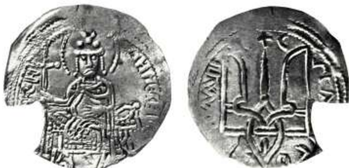
Рис. 8 Срібна гривня Володимира Святославовича (тип IV)