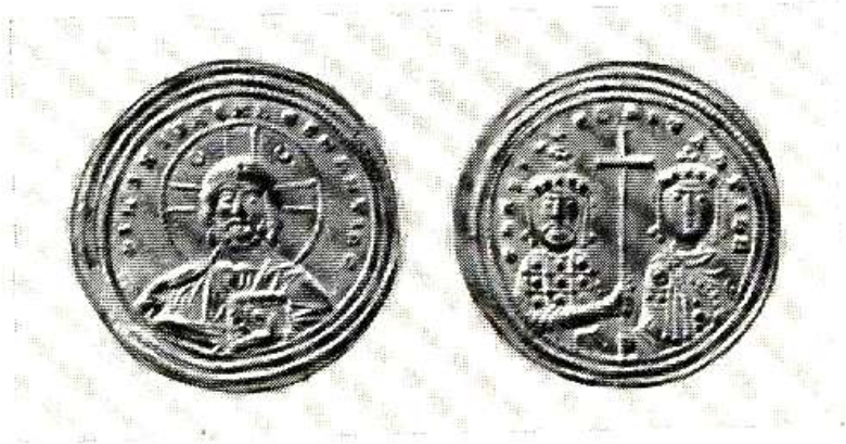
Рис. 2 Візантійські монети соліди X- століття

Окрім символів державної влади в монети вкладався і новий релігійний зміст, який в принципі дублював систему візантійського монетного мистецтва. Випуск староукраїнських монет було політичною декларацією великої держави. Як бачимо із випущених перших монет Володимира Святославовича вони були золотими і срібними. Що стосується золотих монет, то вони всі були випущені одного типу.