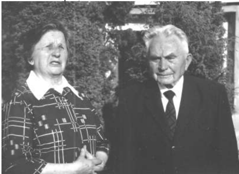
Світлина з дружиною 2003 рік