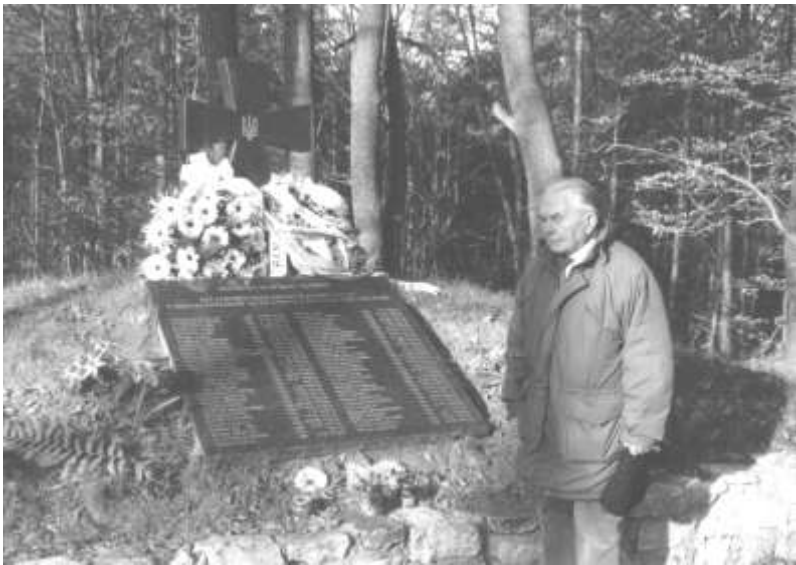
Сучасний вигляд могили воїнам УПА в Монастирі