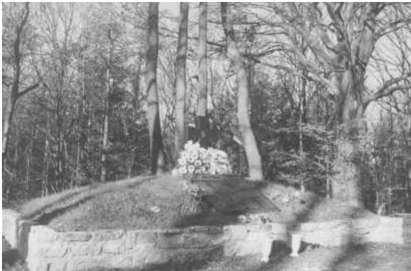
Так виглядала могила воїнам УПА в Монастирі в серпні 2003 р.