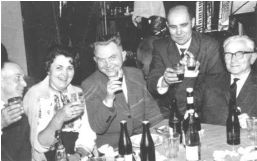
Святкування 10-ти річчя УСТ (1966 р.)