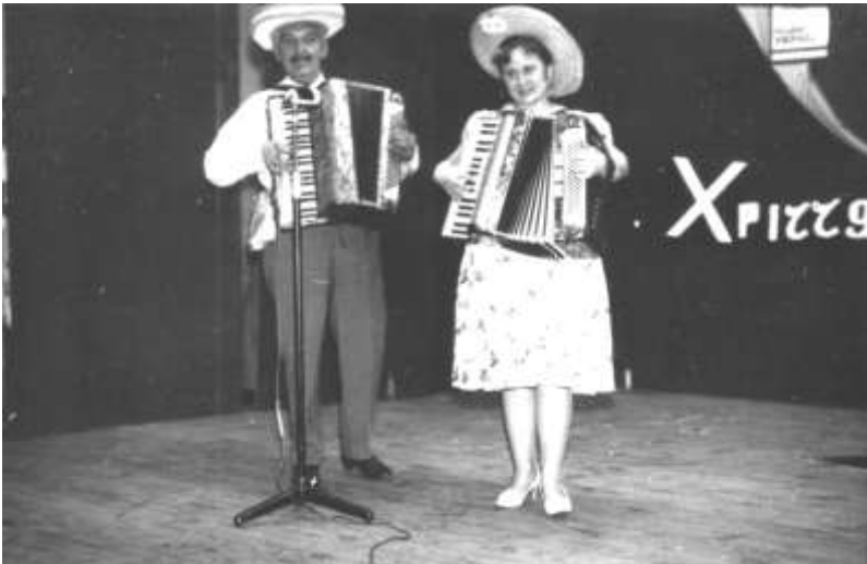
Виступає ансамбль німецької громади м. Вроцлава).