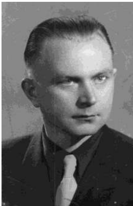
Світлина О.Снігура від 1944 р.