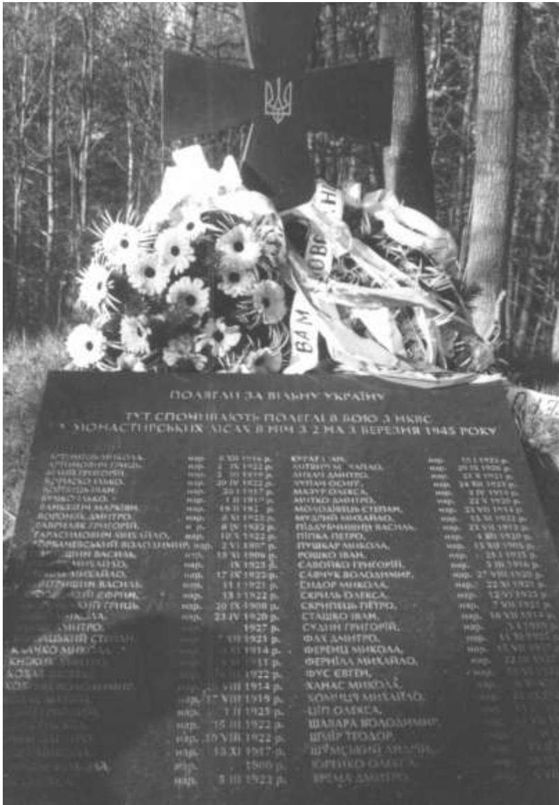
Так виглядає повстанська могила в Монастирі. Світлина виконана 2001 р.