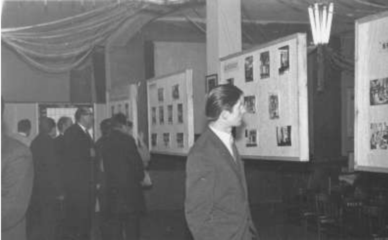
Фотовиставка на 10-річчя УСКТ