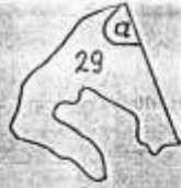
Wrys dziełki skale 1:10000