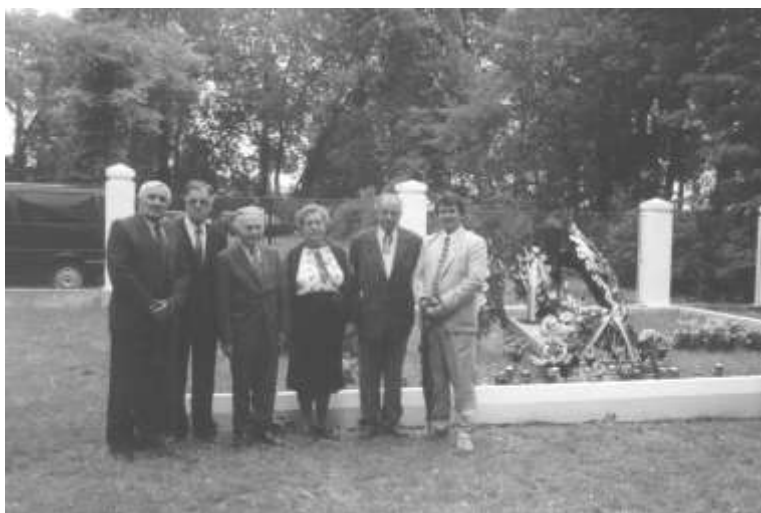
Цвинтар перепохованих воїнів УПА з Бірчі і Лішної в Пикуличах

Тоді ж було висипано на братській могилі в Монастирі курган висотою 1,7 метра, на могилі було поставлено мармуровий чорний хрест в середині якого знаходився тризуб, а також мармурову таблицю з вписаними іменами і прізвищами та рік народження воїнів УПА, які там спочивають.