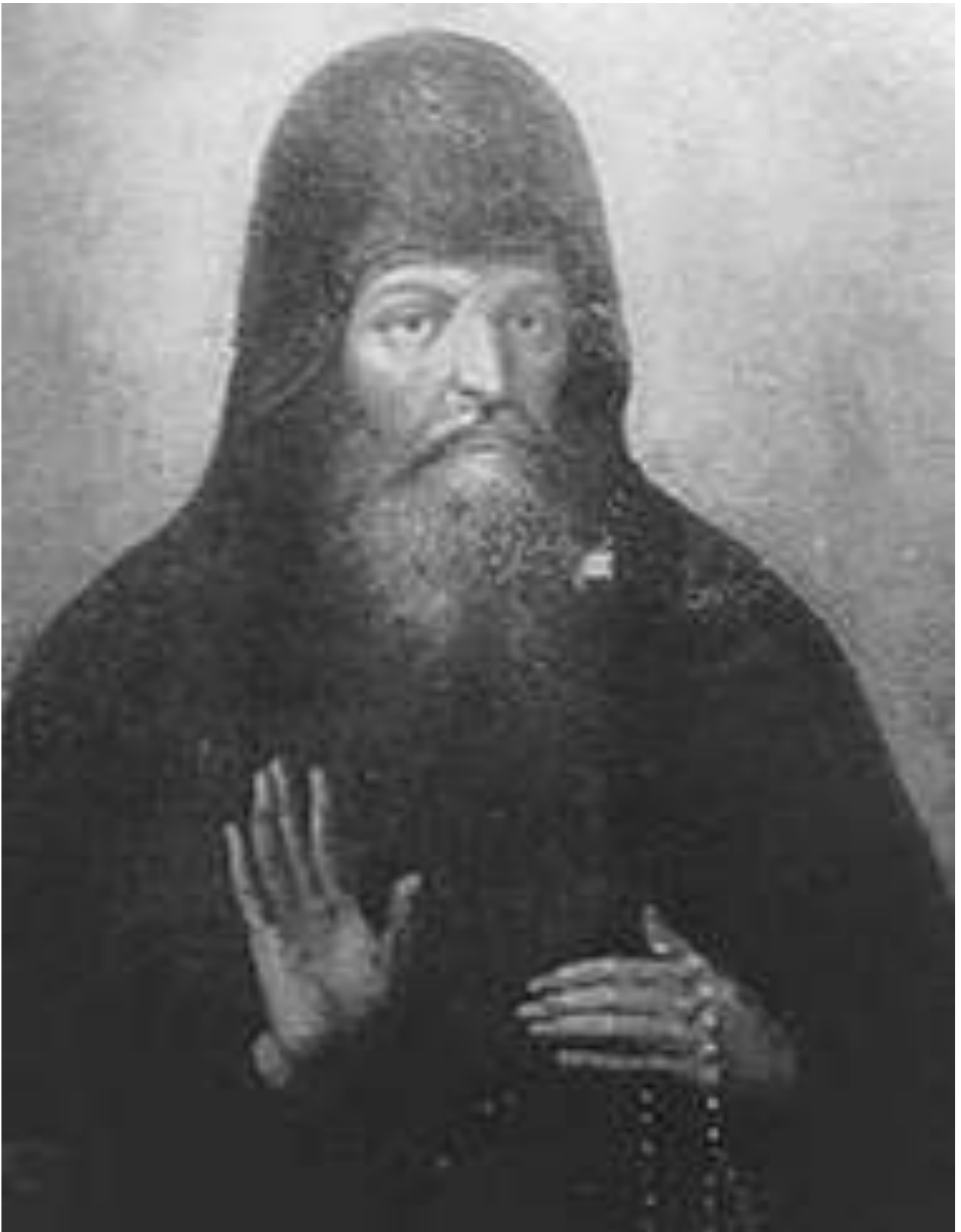
Іларіон Київський – митрополит Руси-України у 1051-1054рр.