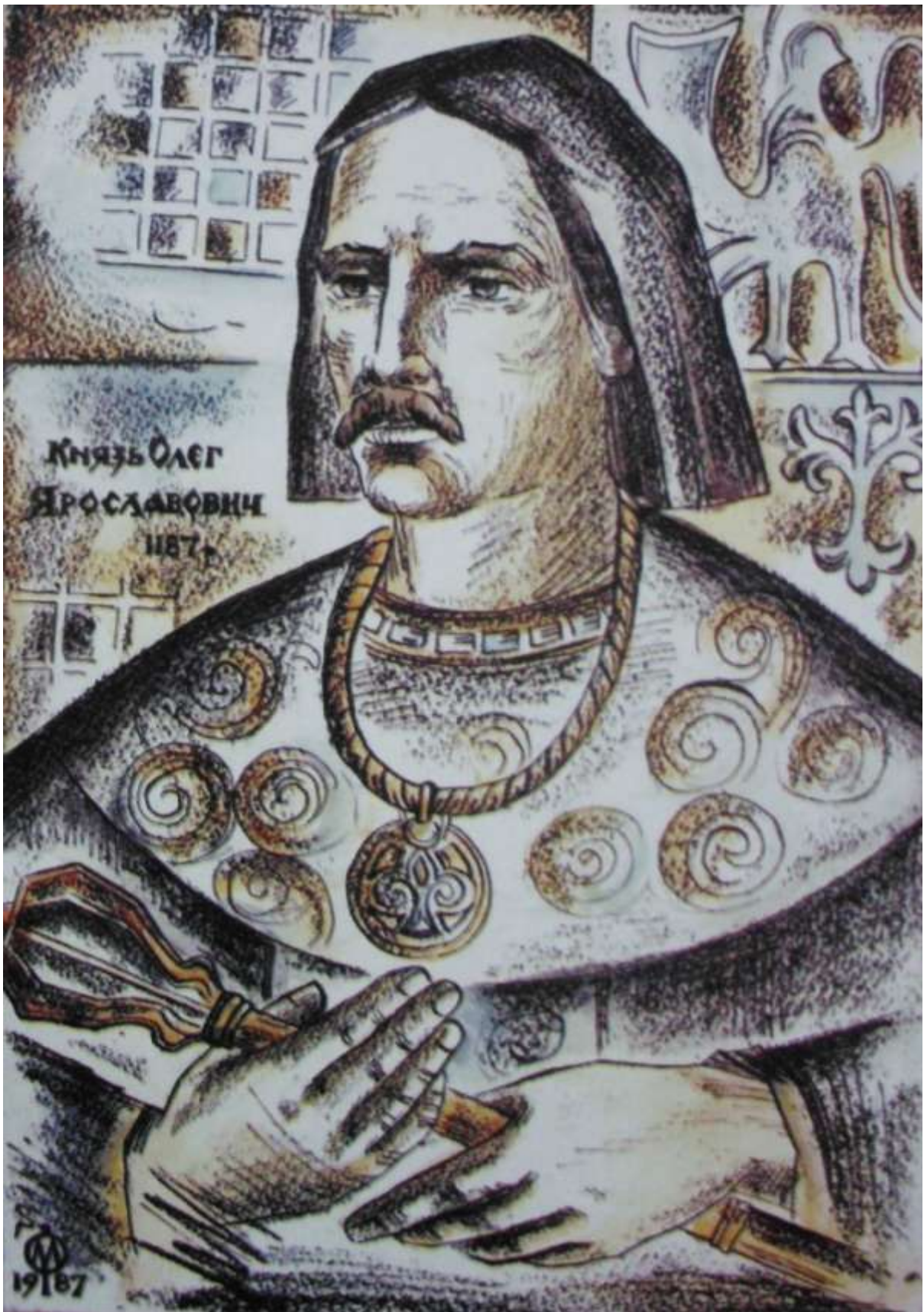
Автор «Слова о полку Ігоревім» – галицький князь у 1187 році – Олег Ярославовч Галицький