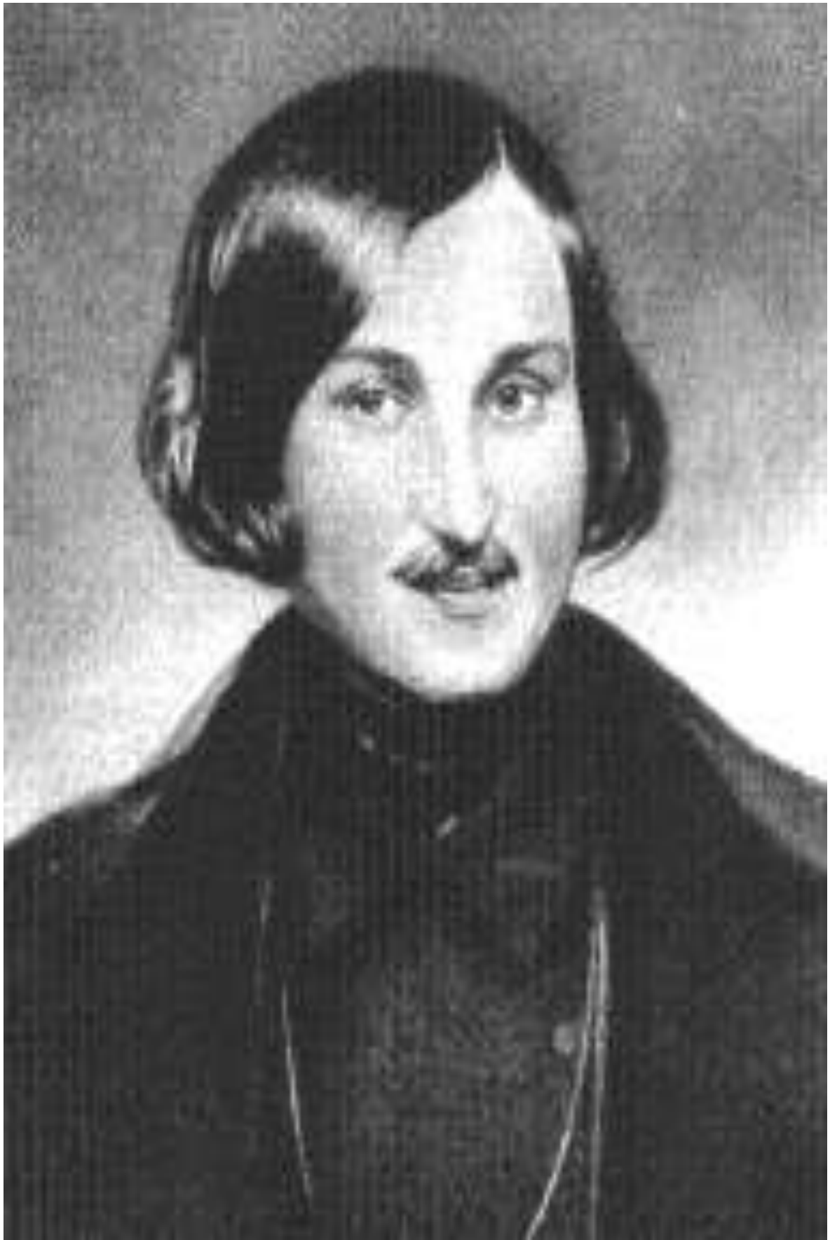
Український письменник М.В. Гоголь